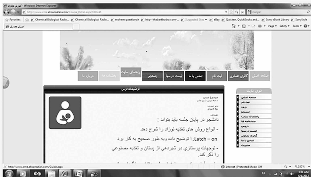
شکل ۳- نمایش اهداف درس