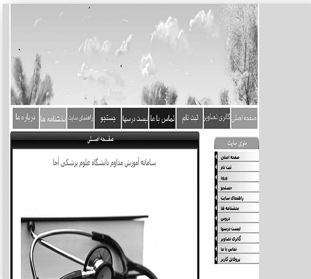
شکل ۱- صفحه اصلی

۸- در حال حاضر آموزش مداوم پزشکان، پرستاران و پیراپزشکان بویژه در موارد مرتبط با طب و پرستاری نظامی در دانشگاه علوم پزشکی ارتش از وضعیت مطلوبی برخوردار نیست و برنامه‌های آموزش مداوم به مواردی مانند برگزاری سمینارها، همایش‌ها و کارگاه‌ها محدود می‌گردد. این روشها هزینه بر بوده و معمولا در مراکز دانشگاهی ارتش و بیمارستانها برگزار می‌شود و به دلایل متعدد ذکر شده در بالا فرصت حضور افرادی که در نقاط دور از مرکز در حال خدمت می‌باشند با سایر افراد یکسان نخواهد بود.