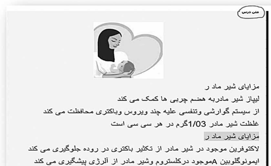
شکل ۴- متن درس

به صفحه تماس با ما در منوی افقی سایت، مراجعه کنند و فرم مربوطه را پر کنند (شکل ۵).