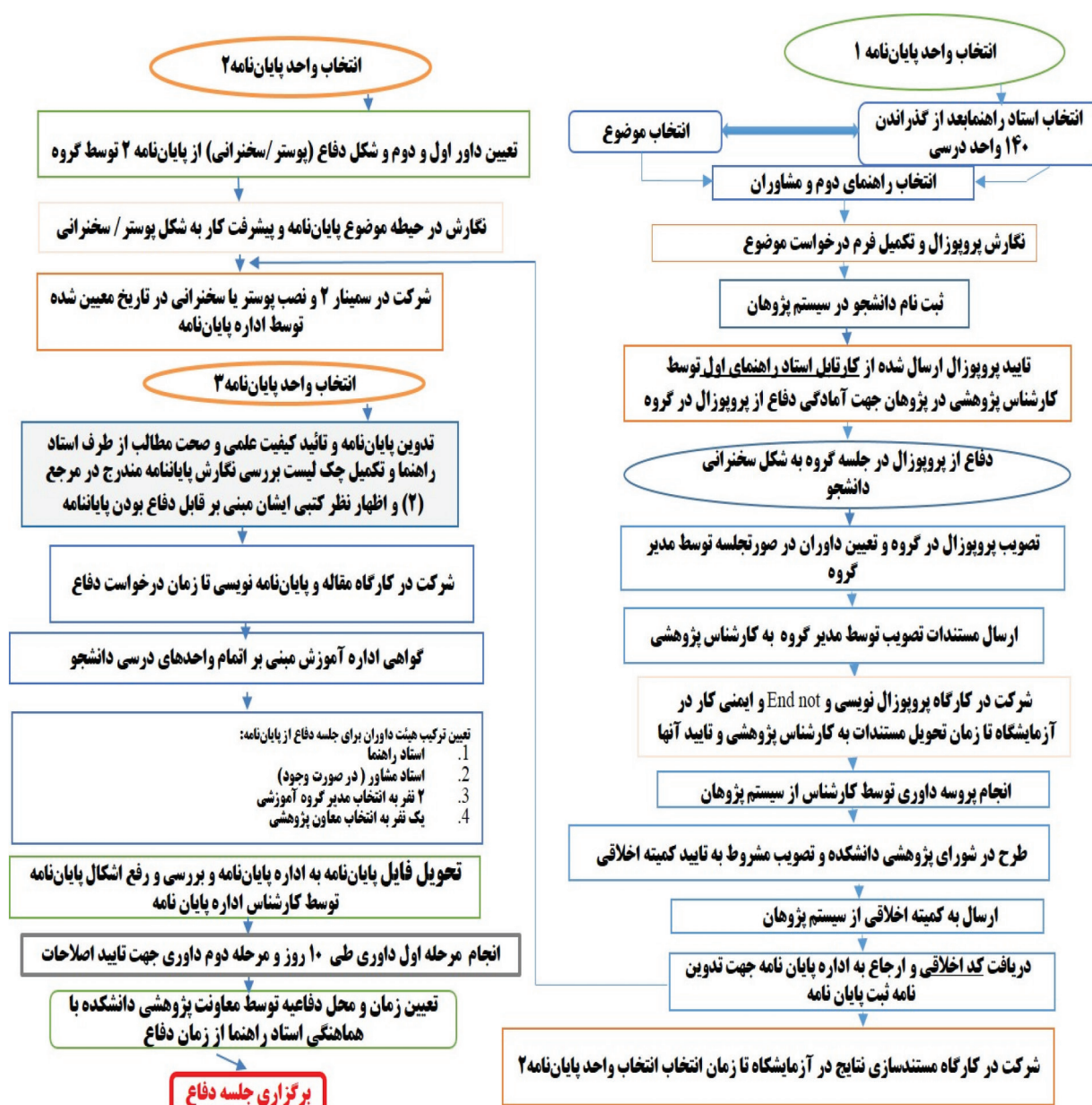
شکل ۱- فلوچارت واحد پایان‌نامه در دانشکده داروسازی تبریز در سال ۹۷

مطالعه حاضر یک مطالعه پژوهشی اصیل به روش پیمایشی است که از نظر هدف، کاربردی می‌باشد. ابزار جمع‌آوری اطلاعات پرسشنامه محقق ساخته است. تمام قسمت‌های پرسشنامه بر اساس قوانین جاری نگارش پایان‌نامه‌ها در دانشکده داروسازی تبریز طراحی و تدوین شد (شکل ۱) و مورد ارزیابی‌های استاندارد سازی قرار گرفت. جامعه‌ی آماری