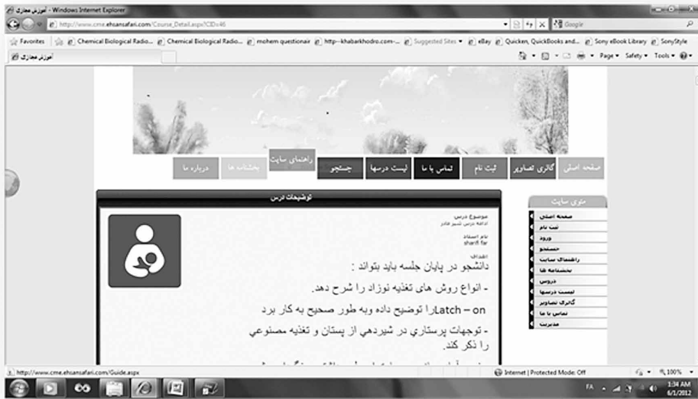
شکل ۳- نمایش اهداف درس