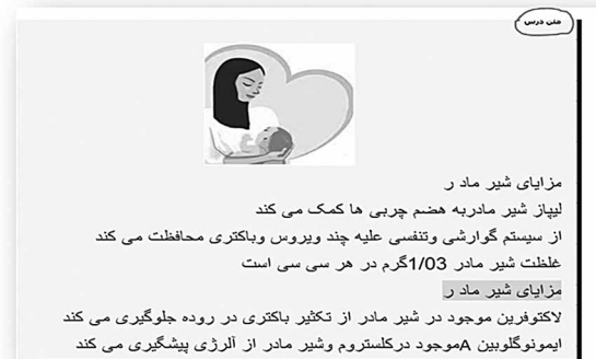
شکل ۴- متن درس

فرا زمان و فرا مکان بودن یکی از مهم ترین شاخصه های آموزش مجازی می باشد که کاربران در سراسر کشور حتی در روستاهای دور افتاده نیز می توانند با کمترین هزینه اطلاعات خود را در زمینه رشته های پزشکی بروز کنند و همچنین سطح