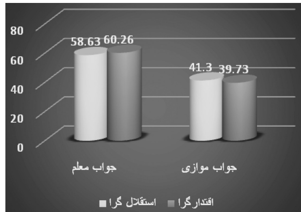
نمودار ۲- درصد پاسخ‌دهندگان به سؤال‌های شناختی پرسش‌نامه

با توجه به مشاهدات انجام شده از نحوه اداره کردن کلاس و نیز نحوه برخورد معلم با دانش‌آموزان، ویژگی‌ها و خصوصیات رفتاری معلمان اقتدارگرا و استقلال‌گرا در سه چک لیست، تقسیم قدرت و نحوه توجه معلم به دانش‌آموزان، روابط معلم با دانش‌آموزان و نحوه تشویق و تنبیه معلم در کلاس طبقه‌بندی شده که در جداول زیر ارائه شده است. در جدول ۱ تقسیم قدرت و نحوه توجه معلم به دانش‌آموزان نشان داده شده است. همچنان‌که در این جدول مشاهده می‌شود، معلم اقتدارگرا در