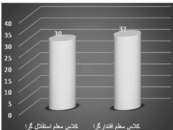
نمودار ۱- فراوانی دانش‌آموزان دو کلاس

سؤال اول: آیا بین شیوه‌های مدیریت کلاس معلمان با عزت نفس دانش‌آموزان رابطه وجود دارد؟