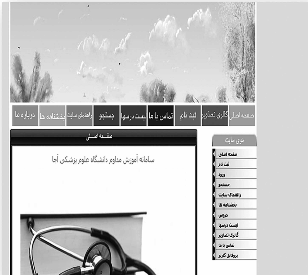
شکل ۱- صفحه اصلی

۸- در حال حاضر آموزش مداوم پزشکان، پرستاران و پیراپزشکان بویژه در موارد مرتبط با طب و پرستاری نظامی در دانشگاه علوم پزشکی ارتش از وضعیت مطلوبی برخوردار نیست و برنامه‌های آموزش مداوم به مواردی مانند برگزاری سمینارها، همایش‌ها و کارگاه‌ها محدود می‌گردد. این روشها هزینه بر بوده و معمولا در مراکز دانشگاهی ارتش و بیمارستانها برگزار می‌شود و به دلایل متعدد ذکر شده در بالا فرصت حضور افرادی که در نقاط دور از مرکز در حال خدمت می‌باشند با سایر افراد یکسان نخواهد بود.